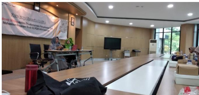
Gambar 3. Pelaksanaan DKT Academic Writing untuk mahasiswa S2 PGMI UIN Salatiga

Kegiatan selanjutnya adalah DKT dengan menghadirkan narasumber. Kegiatan ini dilaksanakan setelah pelatihan Mendeley Reference manager dengan harapan semakin memberikan bekal mahasiswa S2 dalam penelitian dan penulisan. Oleh karena itu pelaksanaan DKT dilaksanakan dengan menghadirkan narasumber yang memiliki pengalaman menuliskan publikasi ilmiah serta menyelesaikan tesis tepat waktu seperti ditampilkan pada Gambar 3.