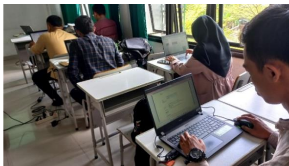
Gambar 2. Pelaksanaan latihan menggunakan Reference Manager Mendeley

Hasil wawancara dengan mahasiswa yang sudah lulus sejumlah sampel 20 mahasiswa menunjukkan bahwa kendala utama adalah memperoleh ide penelitian dan menuliskan laporan dalam bentuk artikel maupun tesis. Hal ini menjadi landasan utama bahwa menulis karya ilmiah dilandaskan pada ide penelitian (Dibia dkk., 2017; Matin & Khan, 2017). Berdasarkan diskusi penjangkaran ide mahasiswa, maka kegiatan pelatihan menulis karya ilmiah perlu dilaksanakan sebagai dukungan percepatan penyelesaian tesis mahasiswa. Tahapan kegiatan diawali dengan pelatihan penggunaan Reference Manager Mendeley seperti pada Gambar 2.