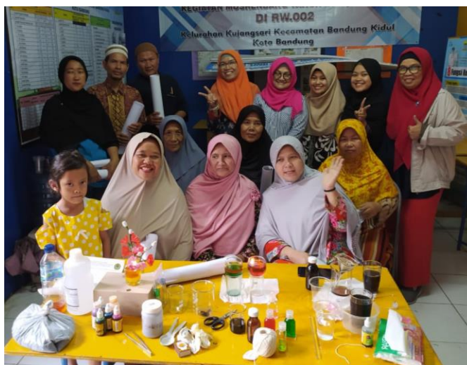
Gambar 4 Foto bersama Kader PKK dan tim Pengabdian Masyarakat jurusan Kimia

Beberapa hasil yang diperoleh dengan adanya kegiatan ini diantaranya, pertama permintaan kembali pelatihan pembuatan sabun dari minyak jelantah, kedua pembuatan lilin aromaterapi bentuk padat dari minyak jelantah, ketiga muncul rekomendasi kepada kader PKK Kp. Lio Kelurahan kujang Sari untuk berwirausaha dengan membuat lilin aromaterapi .