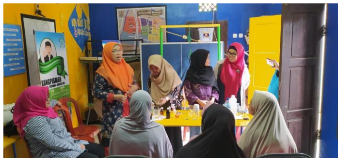
Gambar 2 Penjelasan pelatihan pembuatan lilin aromaterapi kepada kader PKK Kp. Lio Kelurahan Kujang Sari Bandung

Dari hasil kegiatan berjalan dengan baik dan lancar, hal ini dapat dilihat pada kegiatan, para peserta mengikuti kegiatan dengan antusias dapat dilihat pada Gambar 2 dan hasil dari lilin aromaterapi sesuai dengan yang diinginkan. Hasil pelatihan pembuatan lilin aromaterapi berbentuk lilin dalam gelas yang ditunjukkan pada Gambar 3, kemudian diberikan kepada kader PKK. Lilin Aromaterapi diserahkan secara simbolis dari Tim Pengabdian masyarakat kepada salah satu kader PKK Kp. Lio Kelurahan Kujang Sari Bandung, selanjutnya foto bersama antara Kader dan tim Pengabdian Masyarakat jurusan Kimia ditunjukkan pada Gambar 4