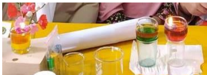
Gambar 3 Produk Lilin aromaterapi dari Minyak Jelantah