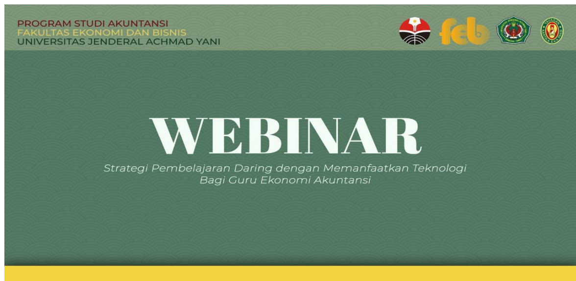
Gambar 2. Tampilan virtual background webinar