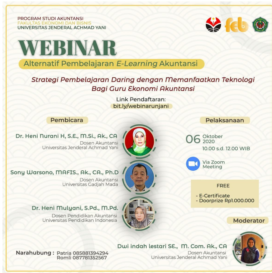
Gambar 1. Flyer webinar