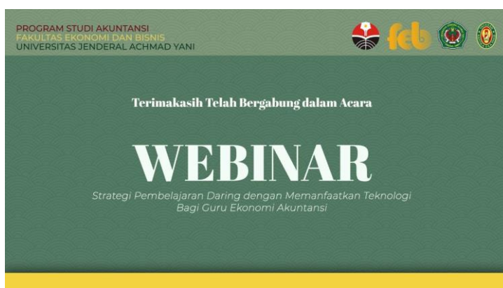
Gambar 8. Tampilan penutup webinar

Acara berlangsung secara tepat waktu. Pada pukul 12.00, pembawa acara menutup acara dan proses pembagian materi serta sertifikat dilakukan dengan menggunakan Google Drive.