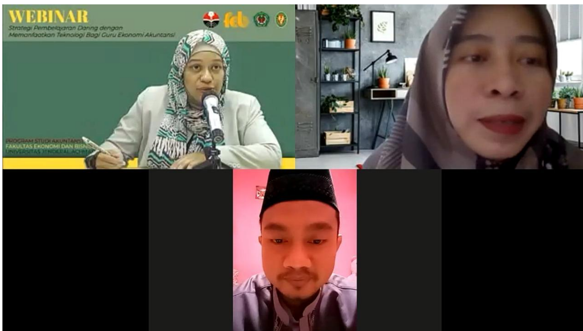
Gambar 7. Sesi tanya-jawab

banyak mengenai hal-hal yang masih belum dikuasai oleh peserta. Akan tetapi, karena waktu yang terbatas, jumlah peserta yang dapat bertanya dibatasi menjadi empat orang. Panitia menyediakan doorprize senilai masing-masing Rp 250.000,00 kepada keempat peserta tersebut. Sesi tanya jawab ini dipandu oleh moderator dan screenshot dari kegiatan ini diberikan pada Gambar 7.