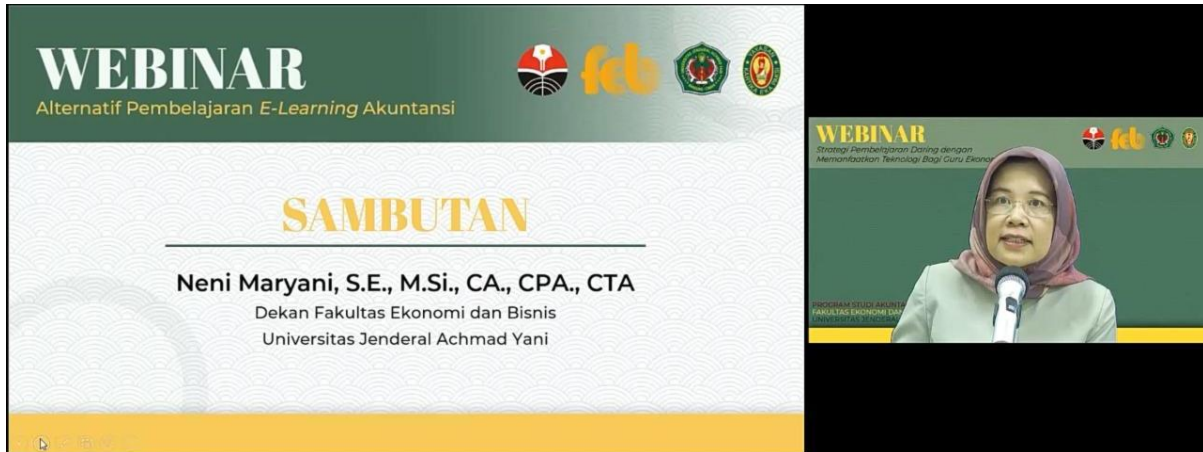
Gambar 3. Sambutan oleh Dekan FEB Unjani

Acara dimulai tepat waktu, yaitu pada Selasa 6 Oktober 2020 pukul 10.00 pagi, dengan diawali pembukaan oleh Dekan FEB Unjani. Tangkap layar dari pembukaan tersebut diperlihatkan pada Gambar 3.