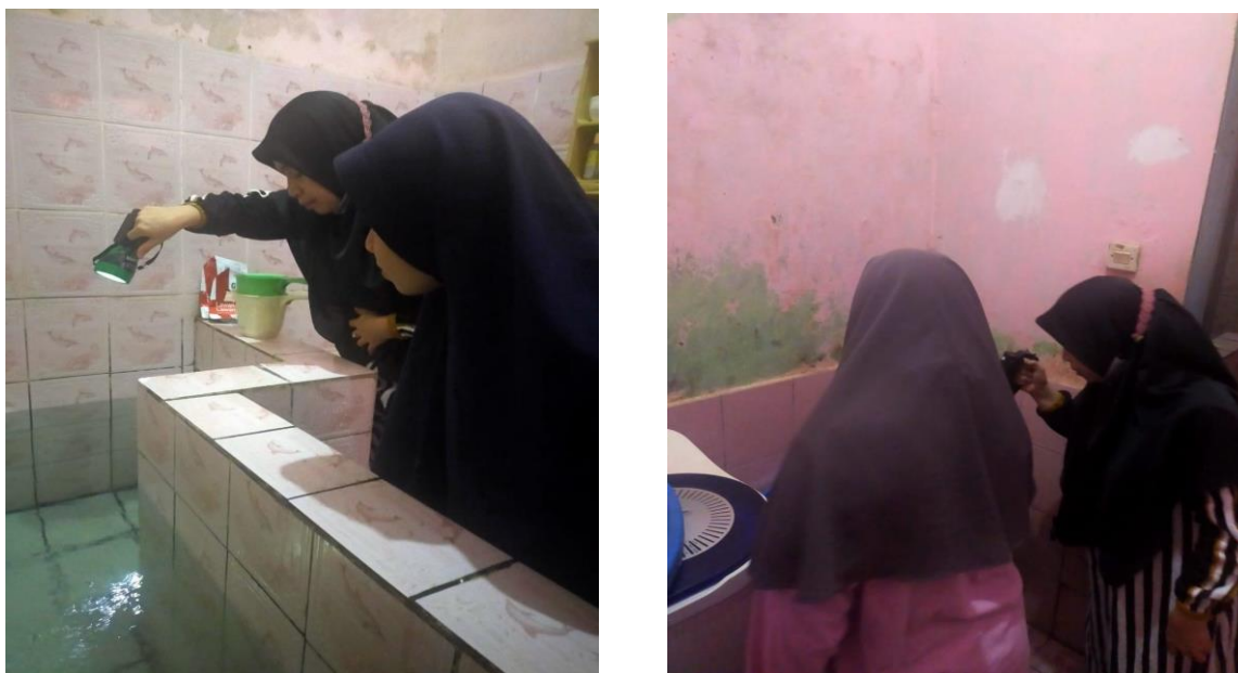
Gambar 2. Pemeriksaan Jentik dan Menjelaskan Ciri-ciri Jentik

observasi sekaligus konseling dan menyampaikan hal-hal penting tentang cara melaksanakan 3M Plus, seperti menguras dan membersihkan tempat penampungan air dengan baik dan benar agar tidak ada jentik yang tersisa, menutup tempat penampungan air, mengubur barang bekas, sampah jenis apa saja yang bisa menampung air, tidur menggunakan kelambu/ lotion anti nyamuk/ spray anti nyamuk dll. Warga juga diajarkan cara mengenali ciri-ciri nyamuk aedes aegypti, serta tanda dan gejala manusia menderita DBD. Selain itu warga dianjurkan menjaga kebersihan dalam rumah dan lingkungan sekitar rumah serta menjaga pola makan dan banyak mengkonsumsi sayur dan buah agar imun tetap terjaga dan tidak mudah sakit. Kegiatan kunjungan dan pendampingan warga dalam memahami 3M Plus diperlihatkan pada Gambar 2.